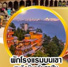
พักโรงแรมบนเขา ชมวิวหิมาลัยสุดฟิน