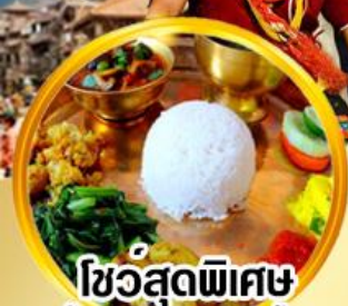
ไข่อุดพิเศษ ลิ้มรสชาติรสป่าลิ้นเต้า

ดินแดนศักดิ์สิทธิ์กลางห้อมกอดหิมาลัย สัมผัสสถาปัตยกรรมอันวิจิตรงดงาม กาฐมัณฑุ โทครา ภัคตาบูร์ ปาทัน นาคาท็อด