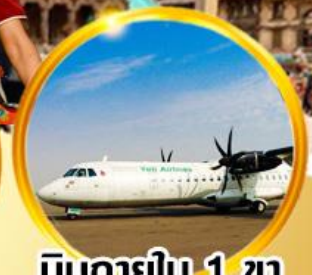
บินภายใน 1 ชม